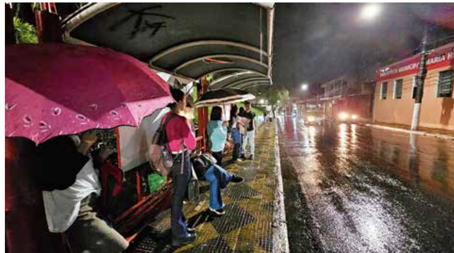
Ponto de ônibus em frente à Igreja Matriz é um dos pontos alertados pelos moradores

Outro ponto questionado por moradores é o localizado em frente ao Terminal Rodoviário, principal partida de linhas como a 219 (Santa Isabel/Estação Armênia).