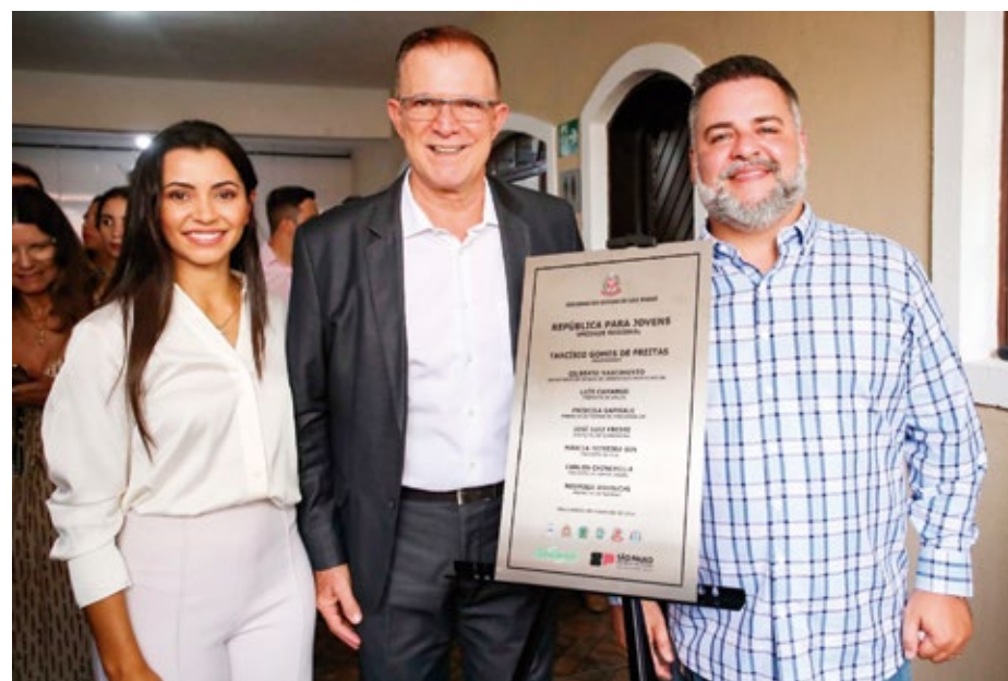
A República Jovem de Arujá está localizada no Bairro Nova Arujá e atenderá jovens e adultos de seis municípios na região.

A república não será apenas um espaço para que o abrigado tenha moradia subsidiada, com local para dormir e comer, mas servirá como suporte e dará a ele acesso aos serviços de educação e qualificação profissional, mas além de terem acesso e encaminhamento as redes de benefícios. “Nosso objetivo aqui é facilitar a reinserção destes jovens na sociedade”, destacou o prefeito de Arujá, Dr. Luís Camargo. Os jovens atendidos receberão ainda suporte socioassistencial por meio do acompanhamento de tutores, assistentes sociais e psicólogos.