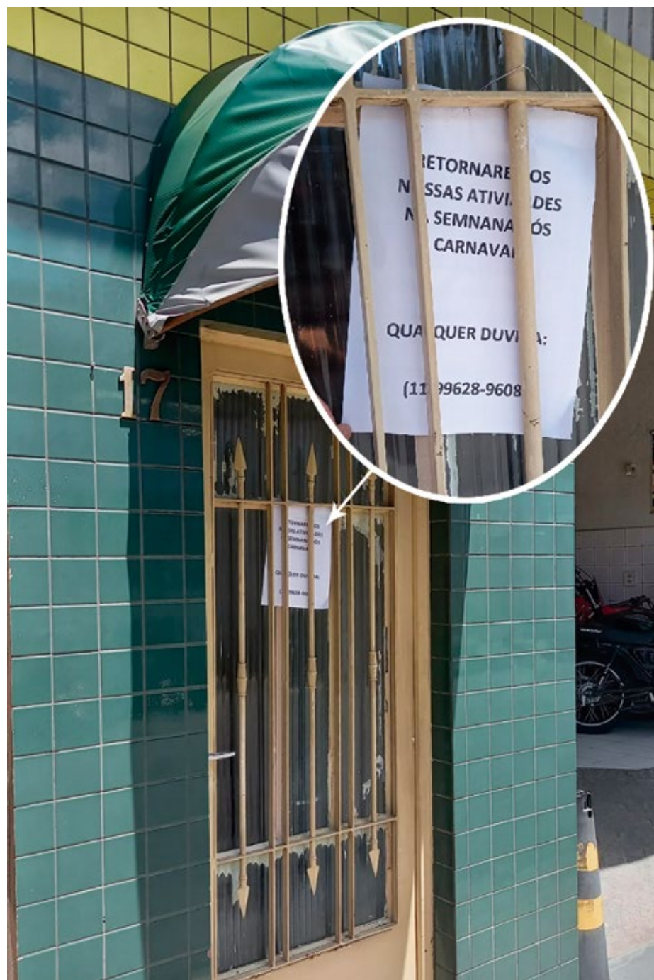
Sede da AETUSI, localizada na Rua 9 de Julho, centro de Santa Isabel, está fechada por recesso e as atividades retornam após o carnaval.

Há quase 15 anos a AETUSI é responsável pela administração dos recursos repassados pela Prefeitura, em cumprimento