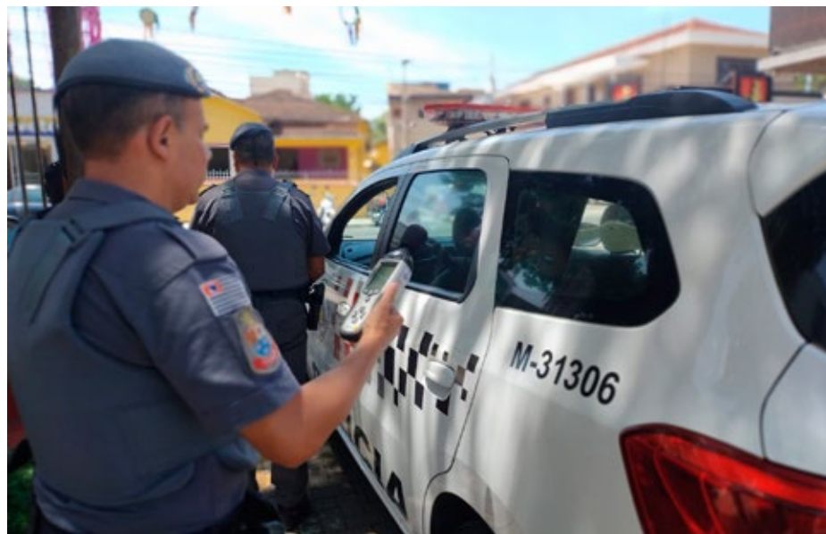
Tenente afirma que a parceria entre Prefeitura e Polícia Militar deverá culminar num trabalho mais efetivo no combate a perturbação do sossego na cidade

veram temas como: legislação técnica; normas técnicas; legislação estadual; legislação municipal; metodologia de constatação; utilização do decibelímetro; método de aferição e coleta de dados; aplicação de sanções e penalidades; veículos e equipamentos de reprodução sonora, além de resoluções e normas legais.