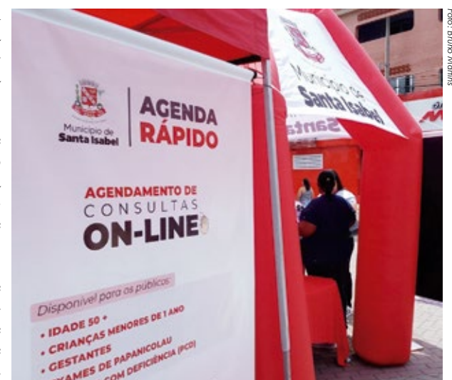
Durante a semana, uma equipe orientou usuários sobre o novo sistema em uma tenda na Praça Fernando Lopes.